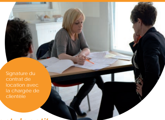
Signature du contrat de location avec la chargée de clientèle