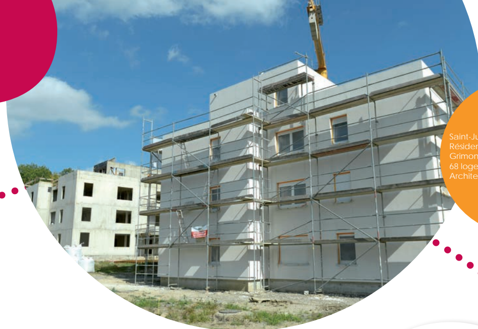
Saint-Julien-lès-Metz Résidence Les Jardins de Grimont 68 logements BBC (VEFA) Architectes : Bolle & Bondue